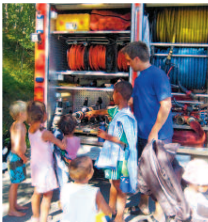
Så här fungerar brandsprutan.