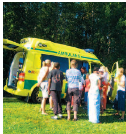
Samling kring ambulansen.