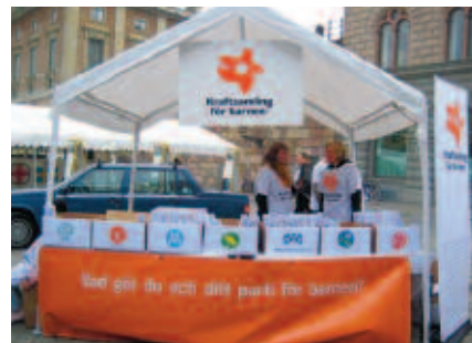
Budkavlarna var placerade i lådor efter partifärg.

Vem har ansvaret för att 250 000 svenska barn lever i utsatthet? Dessvärre är det nog du.