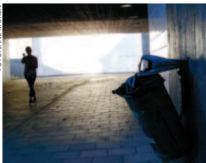
Att inte kunna åka på semester på sommaren är många barns verklighet.

men ofta uppvisar barnen en stor lojalitet mot sina föräldrar och skyddar dem. Och föräldrarna i sin tur försöker skydda barnen.