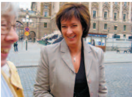
Mona Sahlin (s).